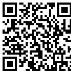
8. 添加剂预混合饲料生产许可证审批